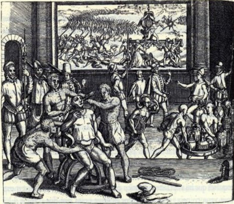
B. Las Casas, Narratio Regionum... , par T. de Bry, Francfort, 1598, planche 14.