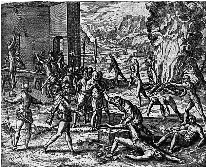
J. Benzoni, Americae Pars Quinta... , par T. de Bry, Francfort, 1595, planche 17.

Quelle est la réaction des conquistadores ?